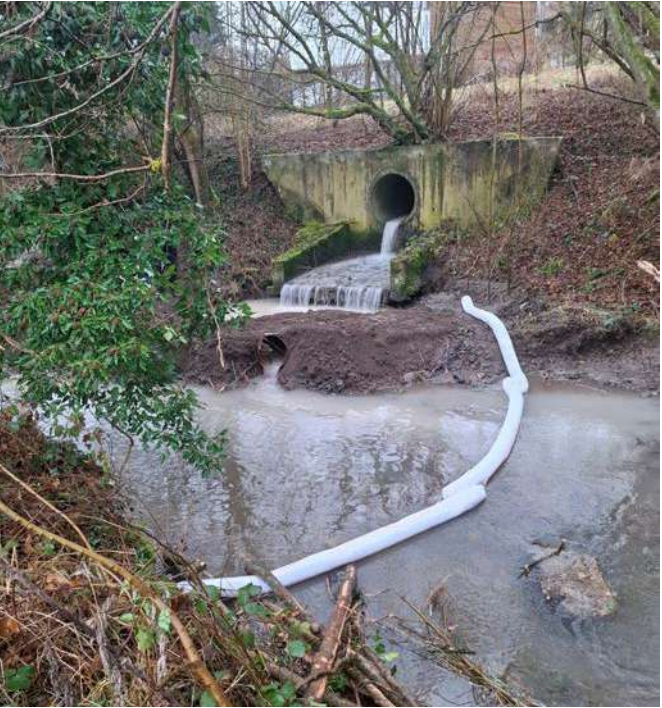
Lorsqu’un cours d’eau est pollué, ETPH déploie des stations mobiles de traitement d’eaux contaminées.