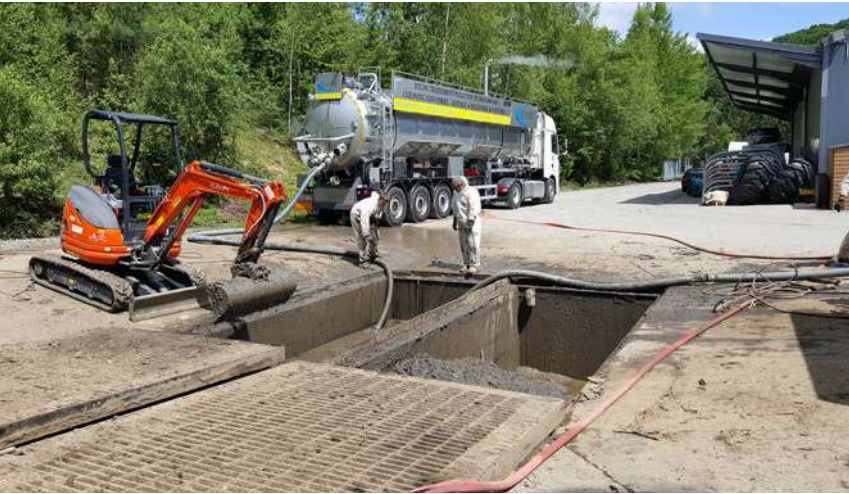
Depuis sa création en 2007, ETPH s’est imposée comme une référence dans les domaines sensibles de la dépollution et du nettoyage industriel.