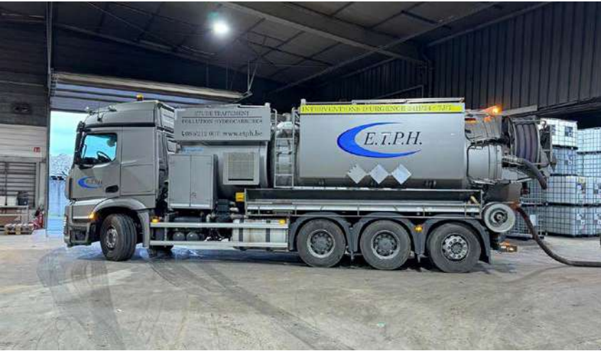
ETPH intervient pour contenir l’urgence, puis assurer la remise en état via excavation des terres polluées.