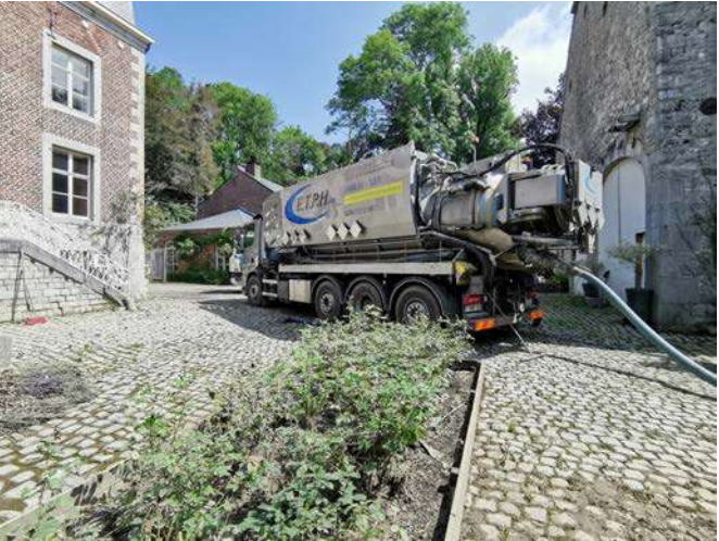
Lors des inondations de l’été 2021, les équipes d’ETPH ont été mobilisées durant plusieurs semaines pour des interventions de pompage.