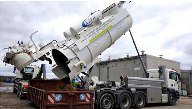
ETPH est agréée comme collecteur et transporteur de déchets dangereux et non dangereux en Wallonie, en Flandre, à Bruxelles et au Grand-Duché de Luxembourg.